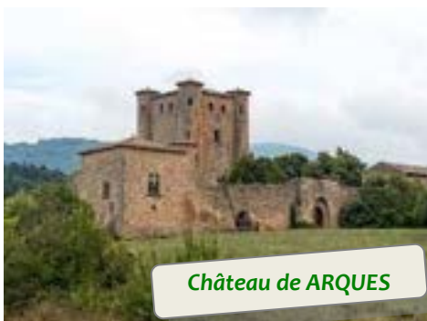
Château de ARQUES

C'est par des routes peu fréquentées par la circulation automobile que vous approcherez les hauts lieux de l'histoire du pays cathare et ses villages typiques