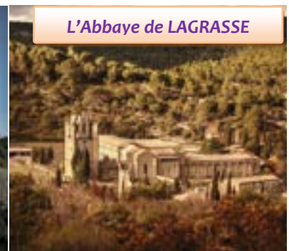
L'Abbaye de LAGRASSE